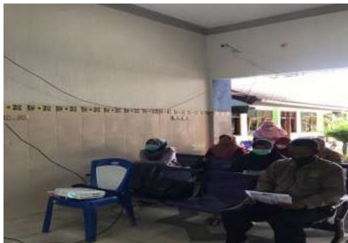
Gambar 1. Peserta Penyuluhan

Berikut adalah gambar tentang penyuluhan kami.