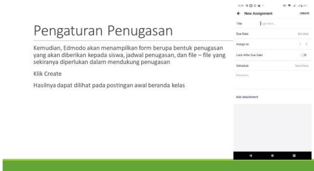
Gambar 3 Materi Edmodo Versi Mobile

dan pengaturan penugasan. Pada sesi ini (Gambar 2), pemateri menjelaskan bagaimana cara melakukan pemberian materi kepada siswa, jenis file apa saja yang dapat di unggah pada halaman Edmodo, dan tata cara bagaimana siswa dapat mengakses materi tersebut. Salah satu fitur yang menunjang keaktifan siswa adalah form penugasan. Fokus utama dari pemateri adalah bagaimana cara memberikan penugasan efektif kepada siswanya di masa pandemi. LMS Edmodo memberikan fitur pengaturan penugasan baik tugas kelompok maupun tugas individu. Para guru dapat mengatur format pengumpulan tugas seperti: kapan tugas harus dikumpulkan ( due date ), kapan tugas tersebut dijadwalkan ( schedule ), dan kepada siapa tugas tersebut diberikan. Jika, para guru mengampu lebih dari 1 kelas, maka pengaturan assign to memudahkan guru untuk memberikan penugasan kepada kelas atau kelompok kelas yang dituju (Gambar 3).