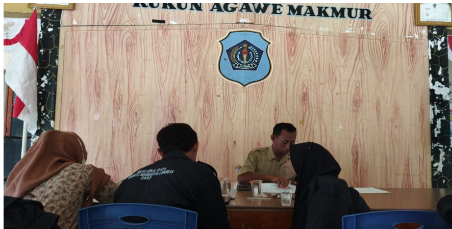
Gambar 1: Pendataan aset Tanah dan bangunan