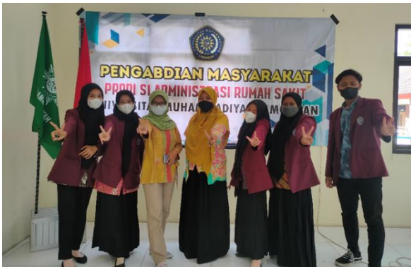
Gambar 2. Foto bersama staff Klinik Muhammadiyah Sugio

Sesudah kegiatan pengabdian masyarakat dilakukan para pengabdian serta mahasiswa yang membantu proses pengabdian berfoto bersama staff Klinik Muhammadiyah Sugio. Bentuk kegiatan pengabdian yang dilaksanakan adalah tanya jawab tentang ISPA serta cara pencegahan dan pengobatan dari penyakit ISPA. Hasil evaluasi setelah kegiatan adalah tingkat pengetahuan peserta berada pada kategori baik dan berjalan lancar, peserta berpartisipasi aktif selama kegiatan berlangsung. Hal ini ditujukan dengan peserta memperhatikan materi yang telah disampaikan, mengajukan pertanyaan mengenai materi yang belum dipahami dan memberikan sumbangan saran.