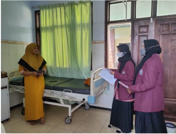
Gambar 1. Kegiatan penyuluhan di ruang rawat inap