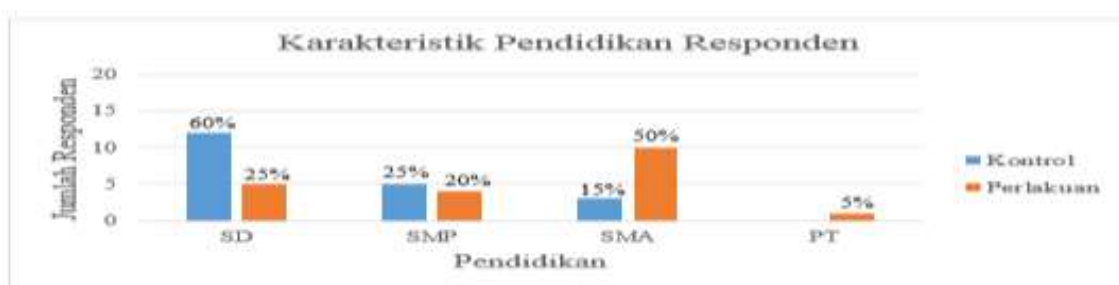
Tabel 2 Distribusi Karakteristik Responden Kelompok Kontrol Dan Kelompok Perlakuan Berdasarkan Pendidikan

Berdasarkan tabel 2 diatas diketahui bahwa sebagian besar (60%), ibu yang mengkonsumsi Pil KB pada kelompok kontrol pendidikan terakhir SD dan sebagian (50%), ibu yang mengkonsumsi Pil KB pada kelompok perlakuan pendidikan terakhir SMA.