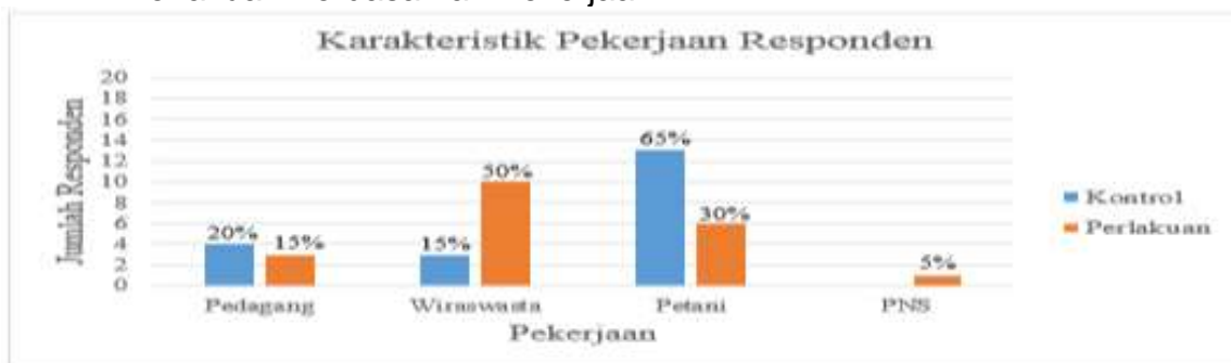
Tabel 3 Distribusi Karakteristik Responden Kelompok Kontrol Dan Kelompok Perlakuan Berdasarkan Pekerjaan

Berdasarkan tabel 3 diatas diketahui bahwa sebagian besar (65%), ibu yang mengkonsumsi Pil KB pada kelompok kontrol bekerja sebagai petani dan sebagian besar (30%), ibu yang mengkonsumsi Pil KB pada kelompok perlakuan bekerja sebagai wirawasta.