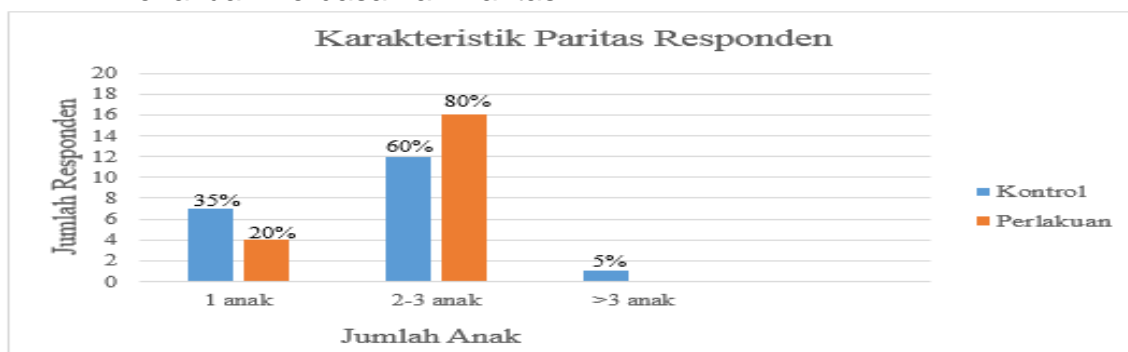
Tabel 4 Distribusi Karakteristik Responden Kelompok Kontrol Dan Kelompok Perlakuan Berdasarkan Paritas

Berdasarkan tabel 4 diatas diketahui bahwa sebagian besar (60%), ibu yang mengkonsumsi Pil KB pada kelompok kontrol mempunyai anak 2-3 dan sebagian besar (80%), ibu yang mengkonsumsi Pil KB pada kelompok perlakuan mempunyai anak 2-3.